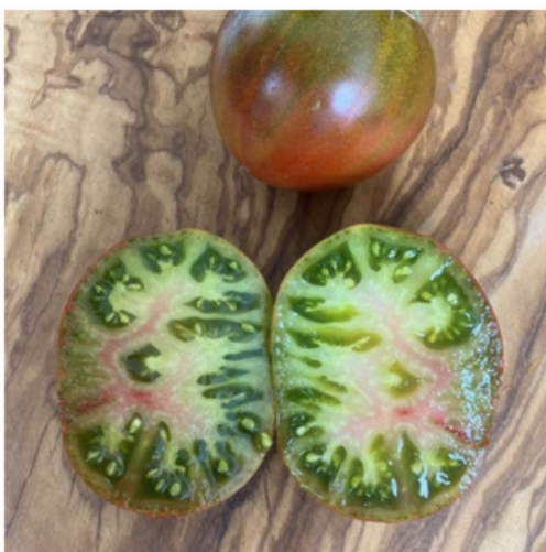
Everett's rusty oxheart