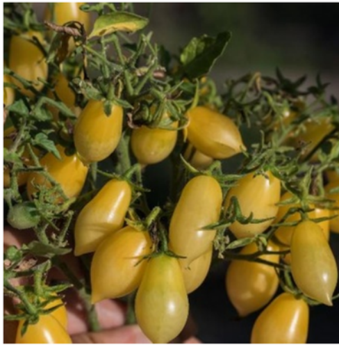
Barry's Crazy (Multiflora)