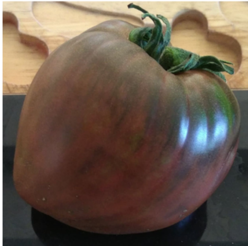
Brad black heart