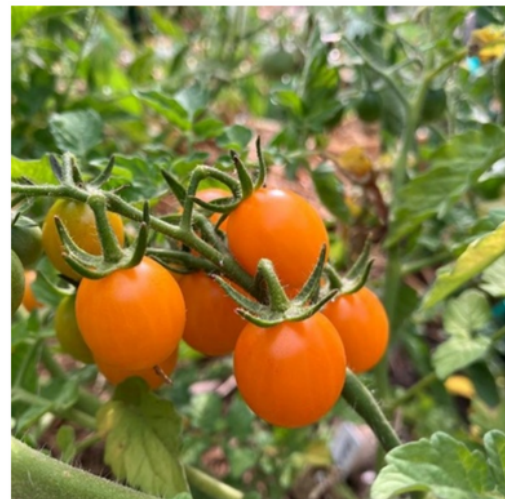
Galapagos (variété sauvage)