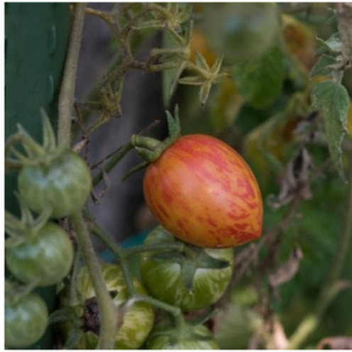
Sunrise bumble bee