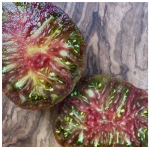
Rojo-Verde ou Bicolore de Jarl