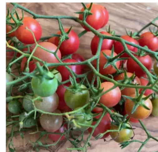
Rose quartz multiflora