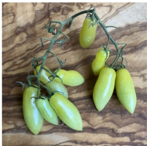
Dancing green fingers