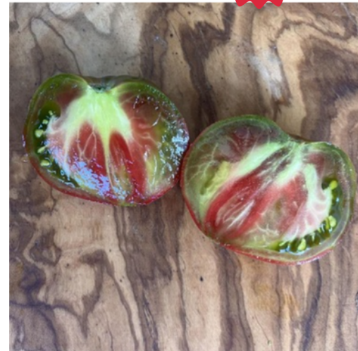
Ananasnoe (coeur d'ananas)