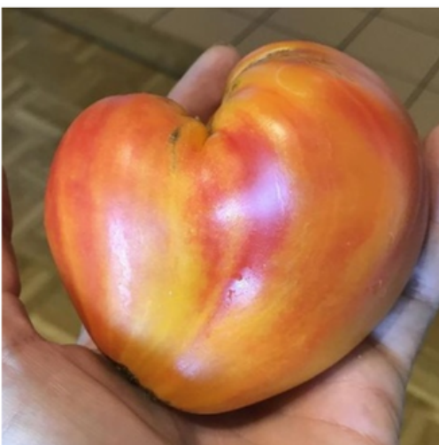
Orange Russian 117