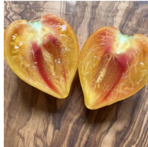
Zolotye gory medeo