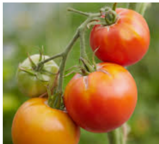
Tomate de Paudex