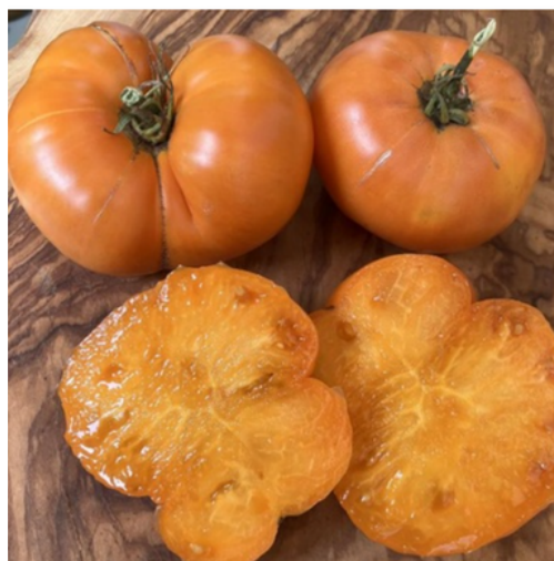
Dr whyche's yellow