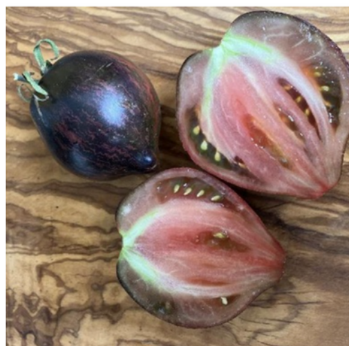
Rebel Starfighter prime