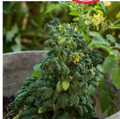
Curley kale (micro Dwarf)