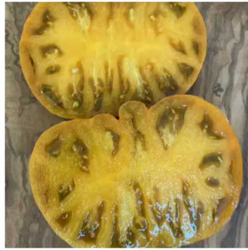
Uluru Ochre (Dwarf)