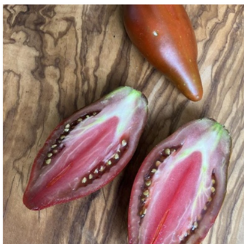
Cuban pepper like