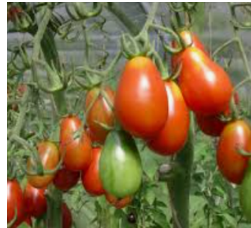
Petite rouge de Bâle