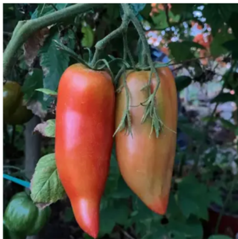
Andine cornue (ou Cornue des Andes)