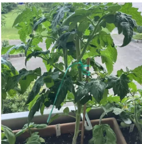
Fat frog (micro dwarf)