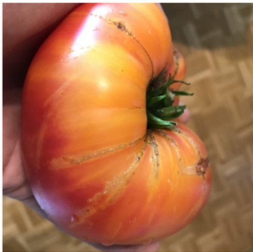
Ananas (feuillage pdt)