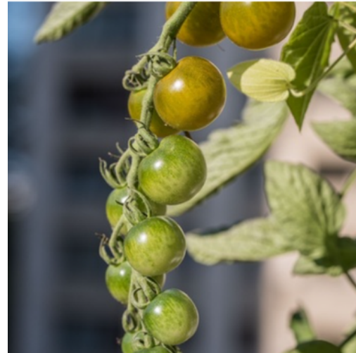
Green Doctor Frosted