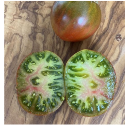
Everett's rusty oxheart