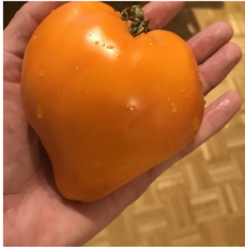
Jaune du Lac de Bret